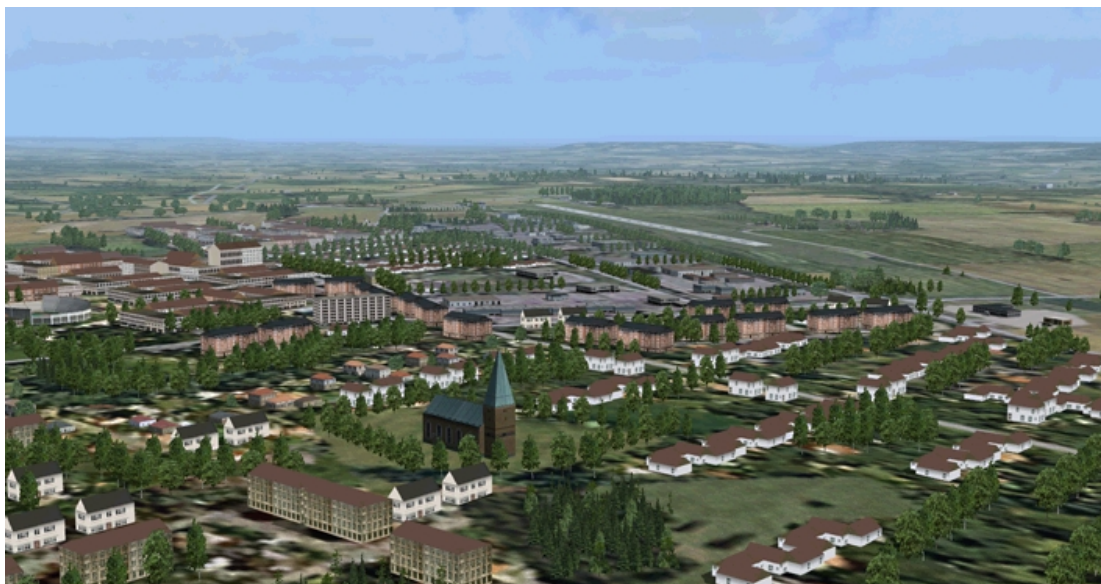
Staden sedd från söder med kyrkan i förgrunden och flygplatsen tätt intill.

Förutom flygplatsen har jag då försökt mig på att göra själva staden lite lik verkligheten. Jag poängterar ”lite”. Det är gjort så att man skall få en känsla av staden på ett hyvsat sätt jämfört med ren autogen. Husen består av kvartersblock i några olika utföranden samt villor och radhus i rader. Dessutom finns det träd i dungar och rader av varierande storlek. Dessa är även utplacerade i staden.