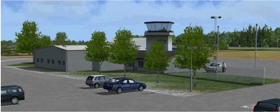
Ovan 3D-träden vid flygplatsens parkering.