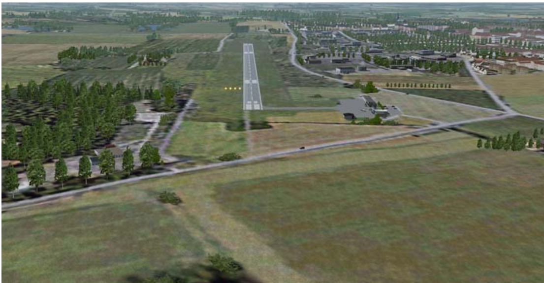
Inflygningen från norr.